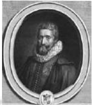
Paul Phélypeaux de Pontchartrain (1569-1621)