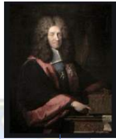
Louis II de Phélypeaux de Pontchartrain Chancelier de Louis XIV (1643-1727)