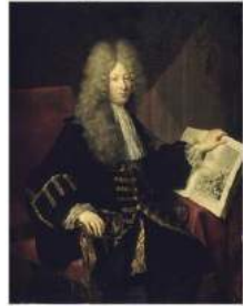
Jérôme Phélypeaux de Pontchartrain (1674-1747)