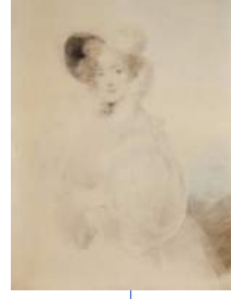
Guido Henckel von Donnersmarck Esther Lachmann dite La Païva (1819-1884)