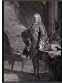
Jean-Frédéric Phélypeaux de Pontchartrain Comte de Maurepas (1701-1781)